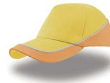
KID RACING Pag. 167