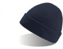
KID WIND Pag. 167