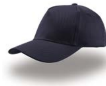
KID START FIVE Pag. 164