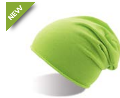
KID BROOKLIN Pag. 163