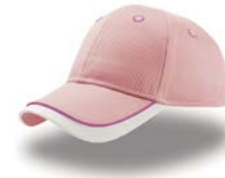
KID STAR Pag. 164