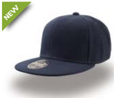
KID SNAP BACK Pag. 162