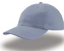
BOY ACTION Pag. 165