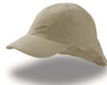
KID NOMAD Pag. 166